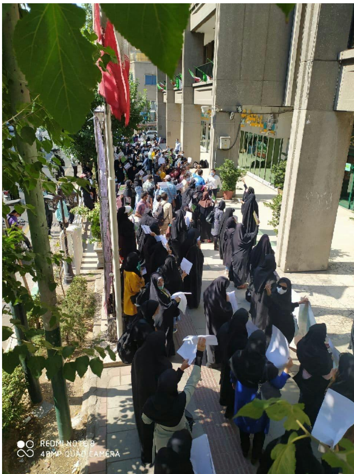
درهمین رابطه: دور جدید اعتراضات قبول شدگان آزمون سال 99 آموزش و پرورش کشور (صاحبان کارنامه سبز آزمون) نسبت به بلا تکلیفی استخدامی با برپایی تجمع مقابل وزارت آموزش و پرورش