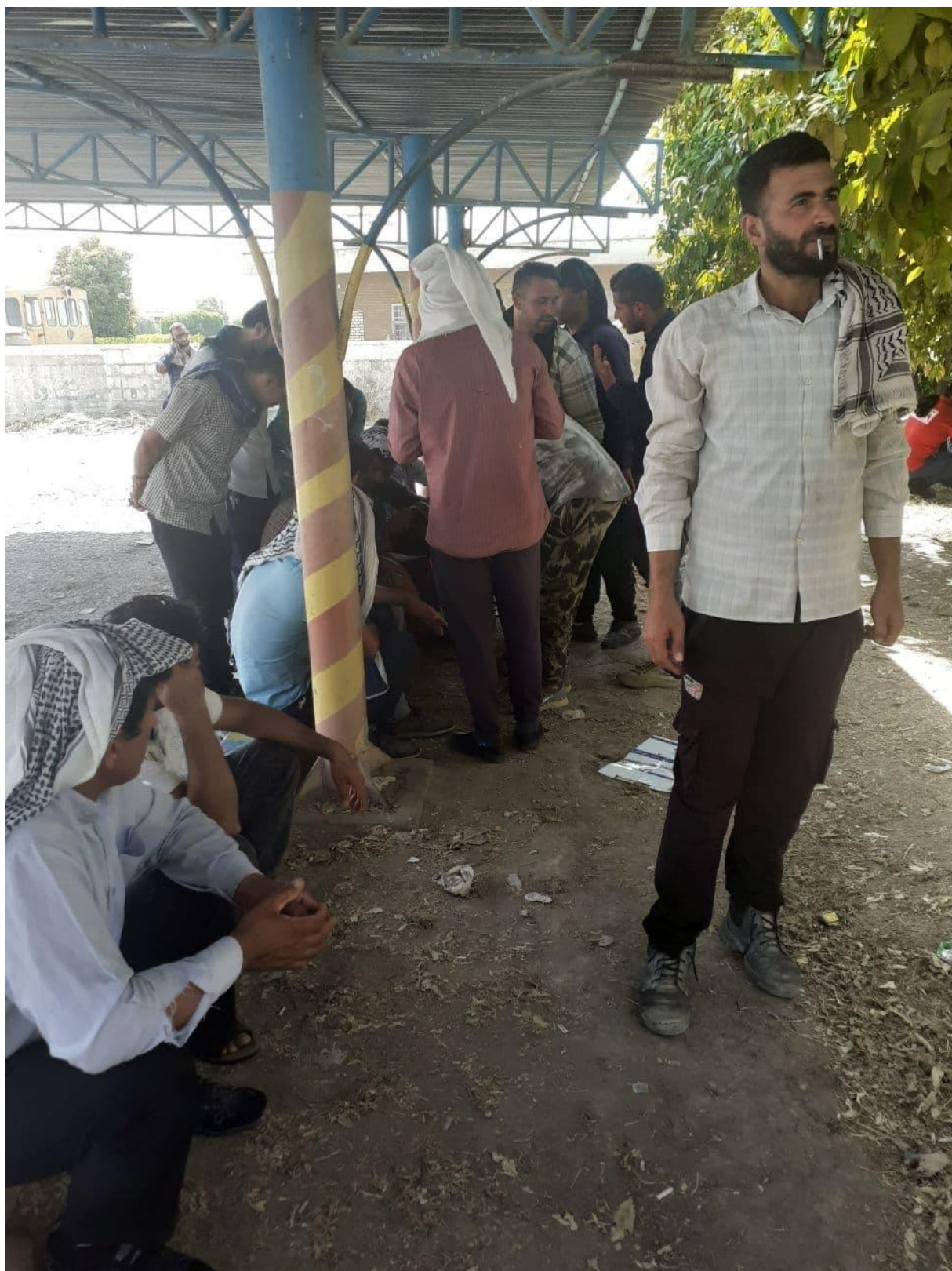
*دومین روز اعتراض کارگران شهرداری خرمشهر نسبت به عدم پرداخت 6 ماه حقوق و 10 ماه حق بیمه و پرداخت ها قطره چکانی با راهپیمایی و تجمع در شهر