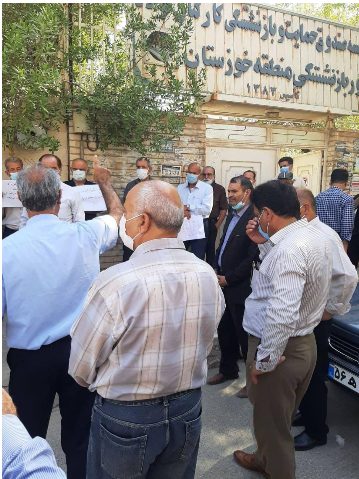
تصویری از تجمع اصفهان: