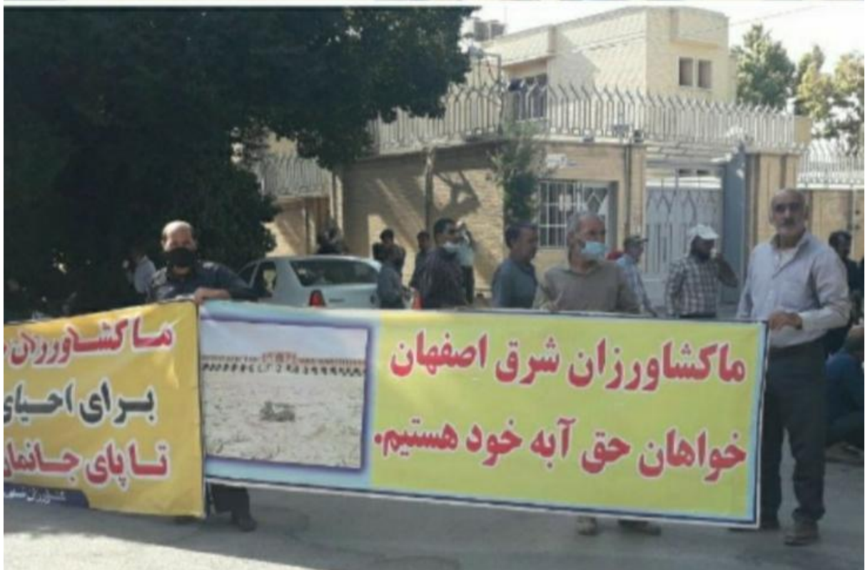
*اعتصاب و تجمع رزیدنت های پوست دانشگاهای علوم پزشکی کشور نسبت به دخالت های سازمان نظام پزشکی